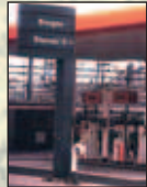
Des véhicules suédois roulent au biogaz et se fournissent à la pompe.